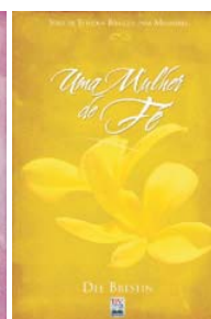
Uma Mulher de Fé