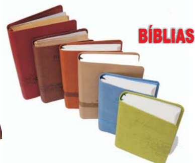
Bíblias em Camurça com e sem Concordância Várias cores e formatos - Almeida Corrige