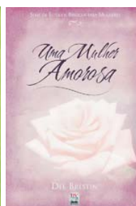
Uma Mulher Amorosa