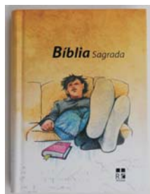
Bíblia da Criança Almeida Corrige Finalmente em Português!

Rua Santos Carvalho, Armazém A - S. Carlos 2725-176 Mem Martins - PORTUGAL Tel. [+351] 21 920 87 13 / 91 662 56 54 De Quarta a Domingo