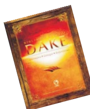
Bíblia de Estudo Dake