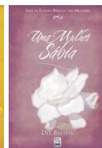
Uma Mulher Amorosa